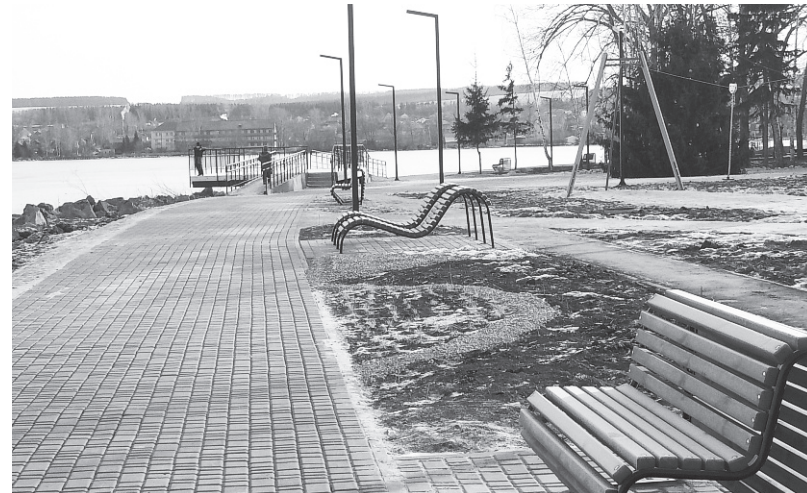
В 2019 году в Сенгилее было создано одно общественное пространство - парк на набережной Волги «Ишь да гладь» и семь дворовых территорий, в текущем году запланировано обустройство городского пляжа и четырех дворов.

Для оценки определено шесть типов городских пространств: жилье, общественно-деловая и социально-досуговая инфраструктура и прилегающие к ним пространства, улично-дорожная сеть, озелененные и общегородские